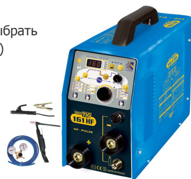
IMS TIG 161 HF с аксессуарами TIG SR17 и набором MMA Ref. 016330