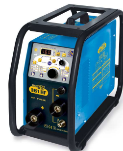
Версия Cage без аксессуаров Ref. 016347